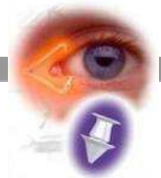
Tapones en lagrimales

En cualquier caso debe ser el oftalmólogo quien debe valorar el tratamiento de cada caso.